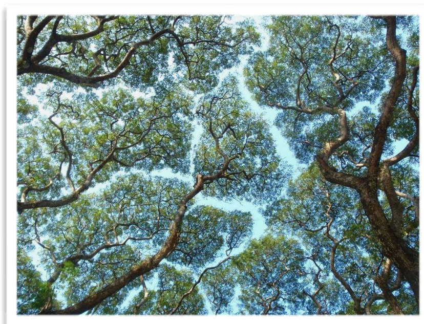
La timidité des arbres.

L'idée est d'apprendre sur les arbres tout en se divertissant.